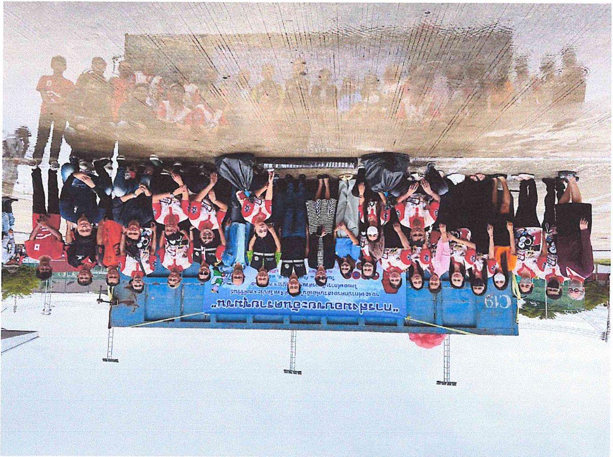
การส่งเสริมการอนุรักษ์สิ่งแวดล้อม